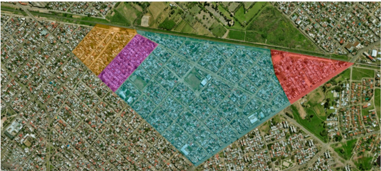
Polígono de intervención del Servicio de Limpieza y Mantenimiento del Espacio Público

Los servicios se prestarán en todos los pasillos, veredas, calles, espacios verdes, canchas y espacios de juego de los barrios Puerta de Hierro, San Petersburgo, 17 de Marzo y 17 de Marzo Bis.