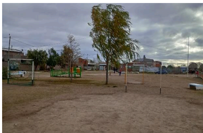
Figura N°2. Cancha de fútbol y del espacio de juegos.