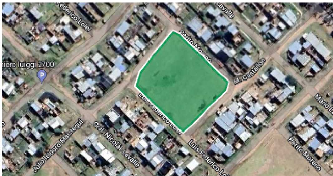
Figura N°6. Zona a intervenir (Más Barrios).

Actualmente este espacio está libre de todo tipo de construcción y cuenta con una dotación de pocos árboles distribuidos dentro del mismo.