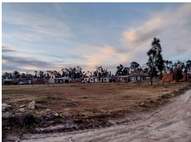
Figura N°7. Zona a intervenir (Más Barrios).