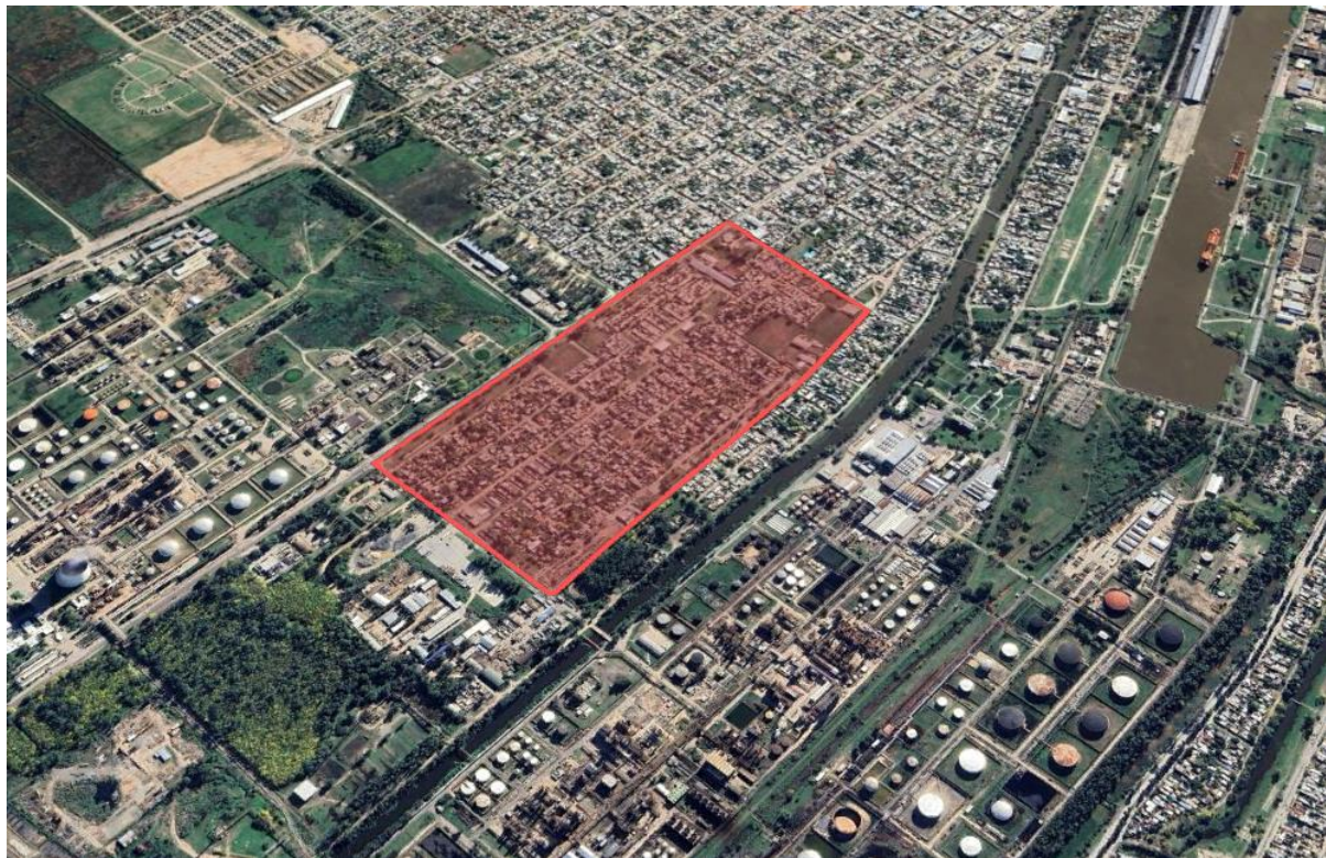
Ubicación Barrio Mosconi