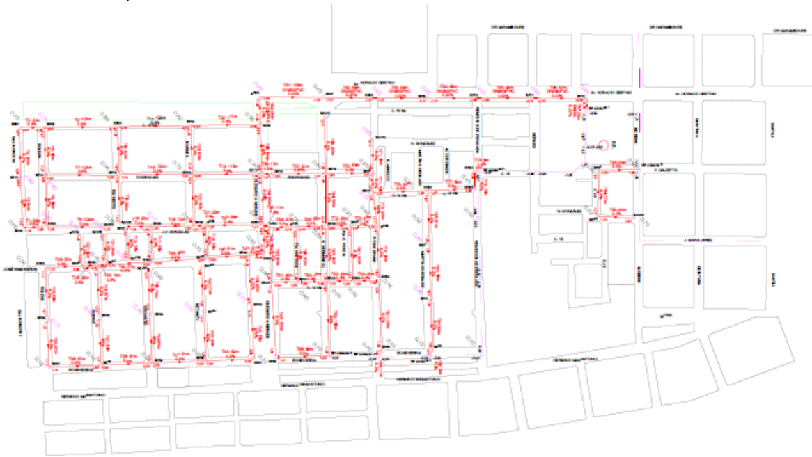
Plano de Red Cloacal

del barrio, quedando sólo un 10% del casco de Ensenada sin acceso a la red.