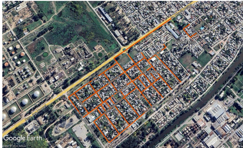
Figura N°2. Plano de Red Cloacal.