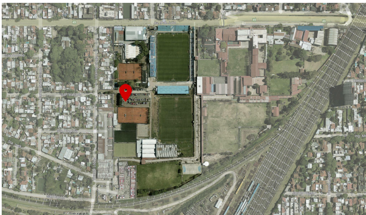
Imagen 1 - Ubicación e identificación del sector de intervención.